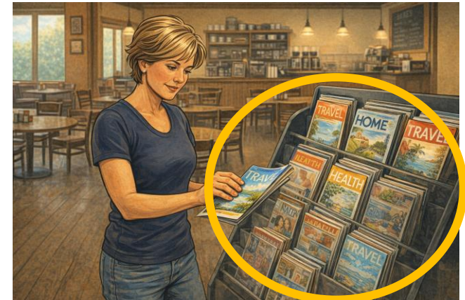
Bild KI erstellt, Prompt: erstelle mir ein Bild im Comicstyle Frau, die nach Gesundheitszeitschriften sucht

Anforderungen an Gesundheitsinformationen zielgruppengerecht und „kurz“ aufgearbeitet, in Leichte Sprache mit Bildern und gut zugänglich