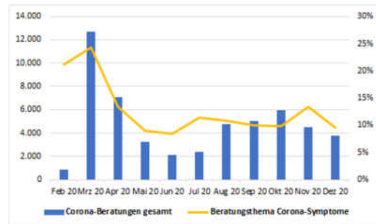
Prozentualer Anteil Corona-Beratungen mit Stichwort Symptome